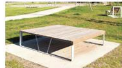
Création de mobiliers