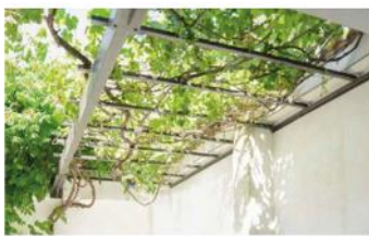
Création d'une pergola