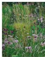
Atelier de plantation